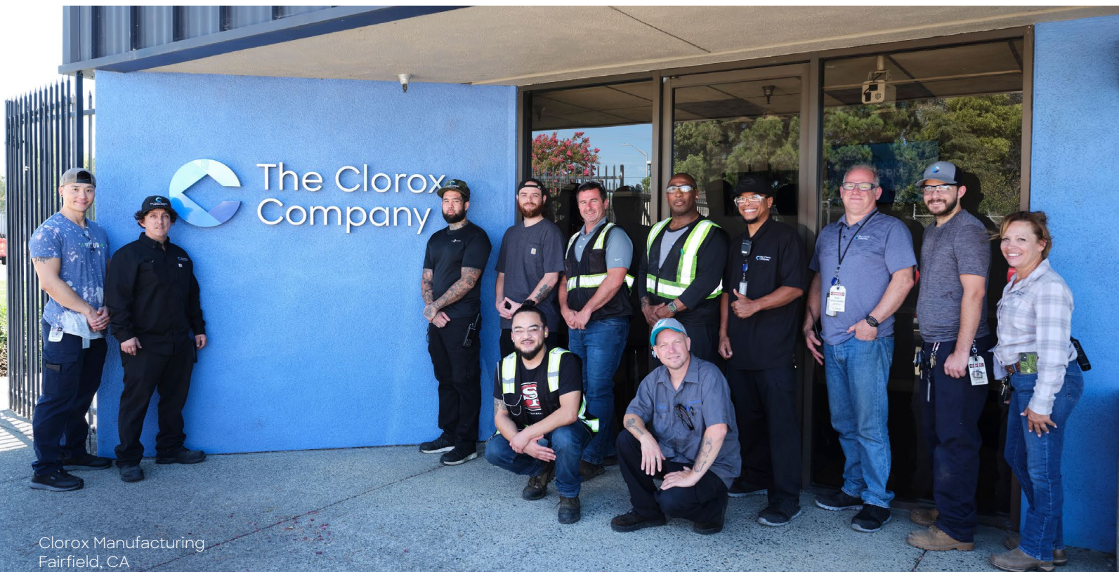
Clorox Manufacturing Fairfield, CA